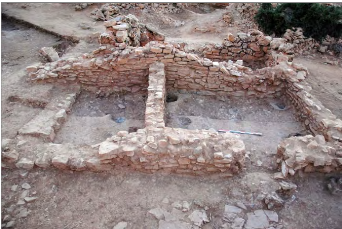
Fig. 2. Vue générale des maisons situées au nord de la mosquée 1 (fin de fouille).

Au sud de la grande-mosquée enfin, le dégagement d'une vaste superficie correspondant à pas moins de douze espaces (resp. P. Wech) a été entrepris aux alentours de la placette qui ouvre sur le