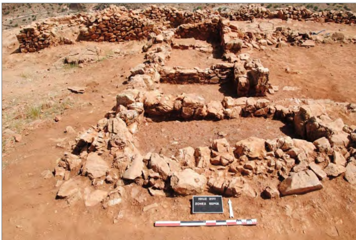
Fig. 3. Zone 2. Maison et Porte.

Le second grand chantier de la campagne 2011 a eu pour objet la porte la plus monumentale de l'enceinte. Sa fouille a permis d'exhumer une partie importante de son élévation, encore relativement bien conservée. Deux états ont pu être identifiés à l'intérieur de la porte, dont le dernier correspond à une transformation d'époque médiévale en lieu d'habitation. Deux maisons, composées de plusieurs pièces ouvrant sur des cours, ont en outre fait l'objet de fouilles cette année dans ce secteur. L'habitat a livré un seul niveau d'occupation, d'époque almohade, bien documenté par l'abondance des pièces céramiques récoltées in situ .