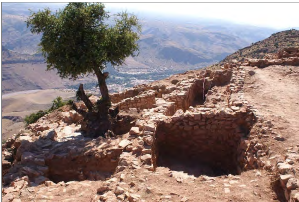
Fig. 1. Zone 5. Secteur d'habitat.

Le secteur d'habitat de la « Grande Maison ». — Il s'agit de l'un des deux principaux chantiers de cette année (avec la fouille de la Porte 2 et de ses environs, voir infra). Si la fouille de la « Grande Maison », l'année dernière, n'avait pas permis de mettre en lumière de manière précise la durée de son occupation, les bâtiments dégagés cette année sur son pourtour ont révélé un ensemble de pièces d'habitation organisées autour de deux axes de circulation perpendiculaires et d'une cour située au Sud de la « Grande Maison ». Les pièces, dont l'élévation conservée est parfois remarquable, ont livré divers aménagements soignés (banquettes, foyers, latrines le long de la muraille), ainsi qu'un matériel céramique d'époque almohade particulièrement abondant. Le plan montre des indices clairs de planification d'ensemble.