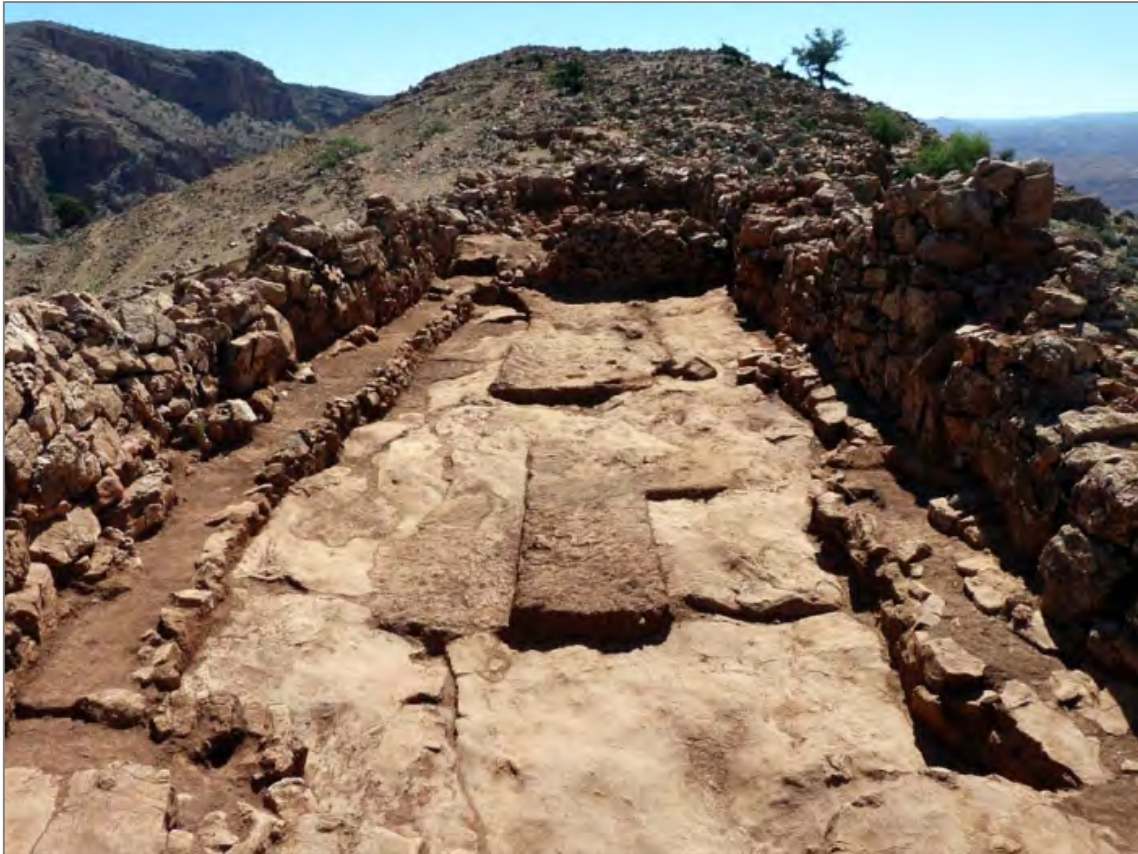
Fig. 5. Vue générale de l'intérieur du Grand Bâtiment. On distingue les deux longues banquettes en vis-à-vis sur les côtés, ainsi que le bout de la plate-forme orientale (au premier plan) ; le mur au second plan est un ajout postérieur.