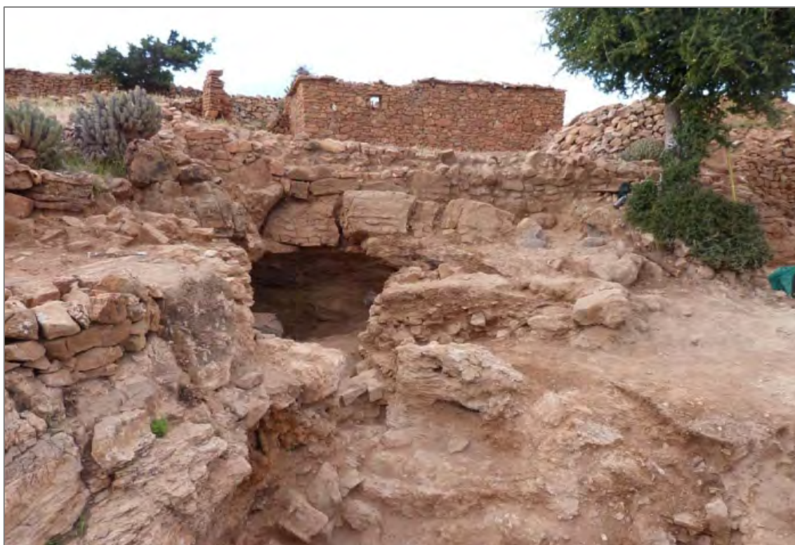
Fig. 2. Zone 5. Secteur Grotte 1.

mettre en évidence, dès cette année, l'ampleur des travaux consentis pour le creusement de l'ensemble. Comme cela avait pu être mis en évidence l'année dernière pour la « Grotte 2 », l'aménagement n'a en effet rien de naturel. La raison de ce creusement n'a pas encore été élucidée : extraction de matériau (la tafza , sorte de mortier maigre argileux dont les constructeurs ont revêtu certaines constructions sur le site), ou aménagement d'un lieu de retraite spirituelle, destiné à abriter des activités dévotionnelles de type ascétique. À l'instar de la « Grotte 2 » fouillée l'année dernière, l'ensemble a été très perturbé par la suite : alors que les autres secteurs du site ont été soit abandonnés, soit réoccupés sans grand dommage porté aux structures antérieures, ces deux « grottes » ont été pillées et systématiquement recreusées. Le secteur a enfin servi de dépotoir durant la période pré-moderne, recueillant les rejets de céramique et d'ossements, reliefs des repas communautaires dits ma'rîf . S'il reste bien entendu impossible d'aller plus avant dans l'interprétation — notamment pour faire de cette grotte le fameux lieu de retraite d'Ibn Tûmart sur la montagne d'Îgîlîz —, la fouille aura permis, du moins pour l'instant, de montrer comment l'emplacement de la grotte structure l'espace adjacent et les proches bâtiments.