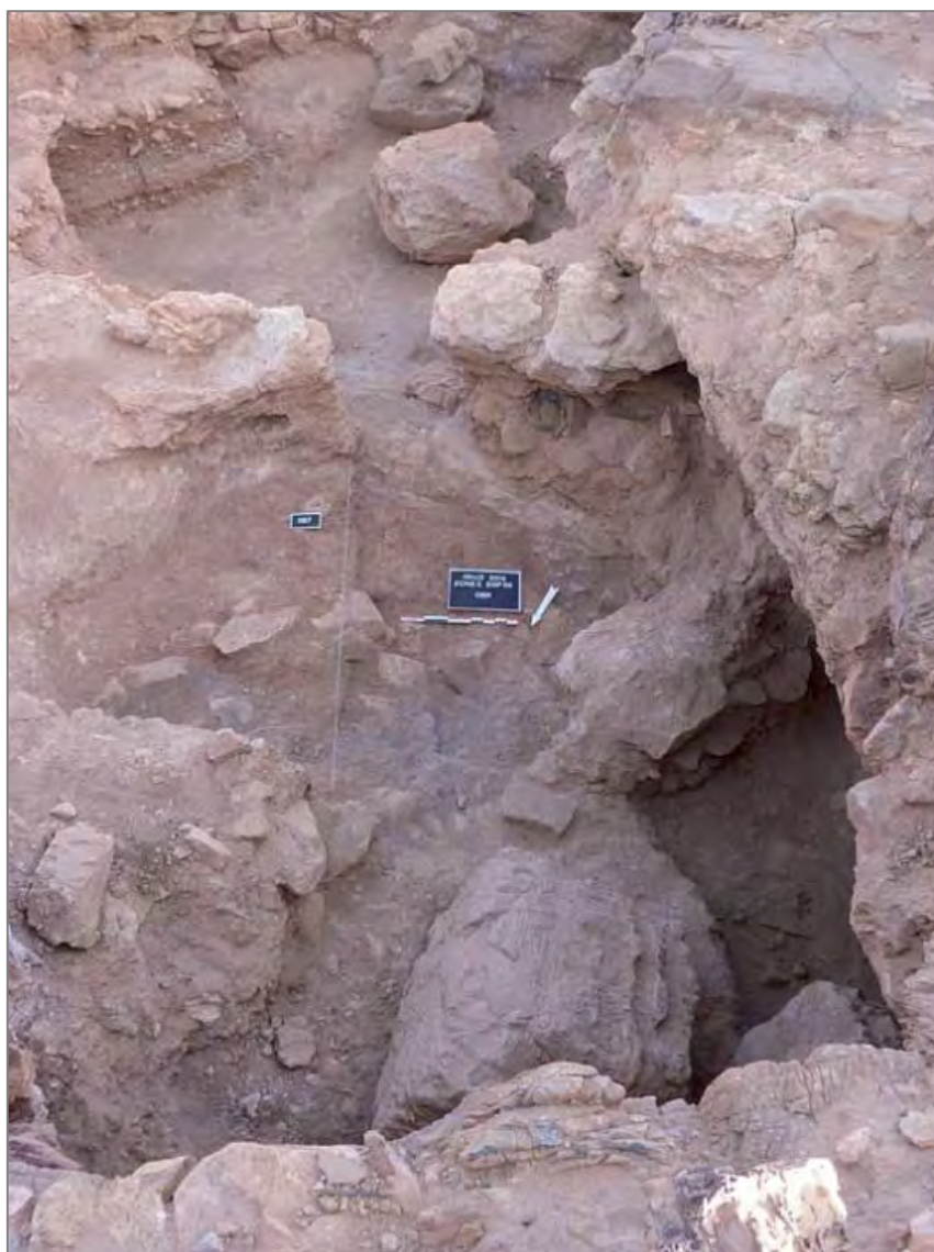
Fig. 4. Vue plongeante sur le niveau d'abandon médiéval de la « Grotte 1 » ; les vestiges des premiers aménagements sont immédiatement en-dessous de ce niveau.

le décapage a concerné cette année le secteur situé en contrebas de ce secteur et à proximité de la Porte 1, dévoilant un ensemble formé de trois grandes pièces associées à des cours.