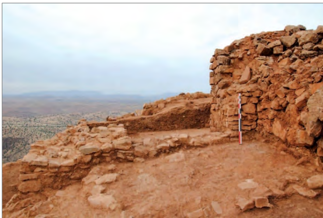
Fig. 6. Entrée de la Porte 1, vue depuis le nord.

Le Jebel central est protégé par une double ligne de murailles, dont la datation d'époque almohade est restée un a priori durant les deux premières campagnes de travaux archéologiques. En 2011 toutefois, la fouille de la Porte 2 nous a permis de corroborer cette datation hypothétique, tout en montrant le caractère véritablement monumental d'une construction conçue pour impressionner. Dès lors, il semblait logique de procéder à la fouille de son pendant, la Porte 1, située au sud-est du Jebel central, et dont on pouvait attendre à bon droit au moins le même effet de monumentalité une fois dégagée de ses éboulis. Il a fallu, pour mener à bien cette opération, condamner l'accès contemporain au site. Les résultats sont à la mesure des efforts consentis pour fouiller cette structure, et des problèmes en relation avec le contournement de l'obstacle qu'a constitué par ce nouveau secteur en cours de fouille.