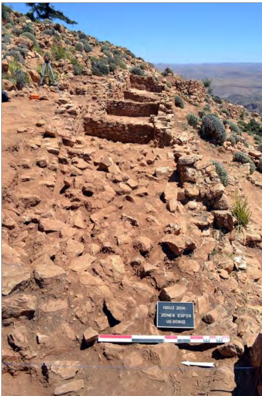
Fig. 4. Vue générale des pièces de vie de la zone 8 (en cours de fouille). Les pièces, vues ici en enfilade, sont séparées par des cloisons mitoyennes qui s'appuient toutes sur un long mur de fond rectiligne et tracé d'un seul jet.

un intéressant mobilier d'époque almohade, ainsi que des aménagements attestant le niveau de vie de leurs habitants.