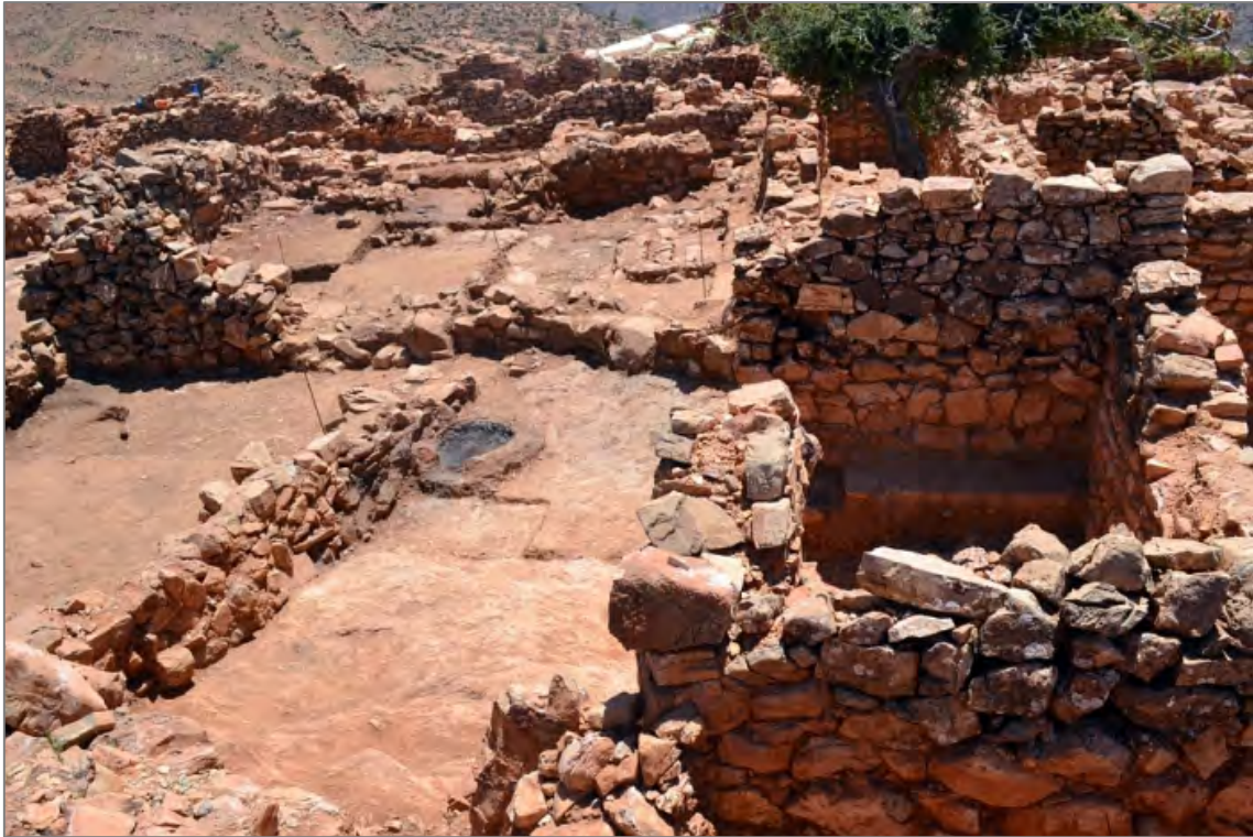
Fig. 1. Le secteur d'habitat au nord de la Mhadra (fin de fouille). Au premier plan, la pièce 82 et sa cour ; au second plan, l'autre maison fouillée en 2014.