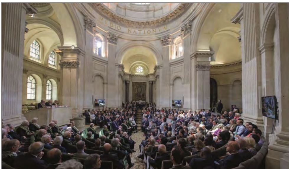
Fig. 4 : Cérémonie de remise des Grands prix scientifiques sous la coupole de l'Institut de France, mercredi 3 juin 2015.