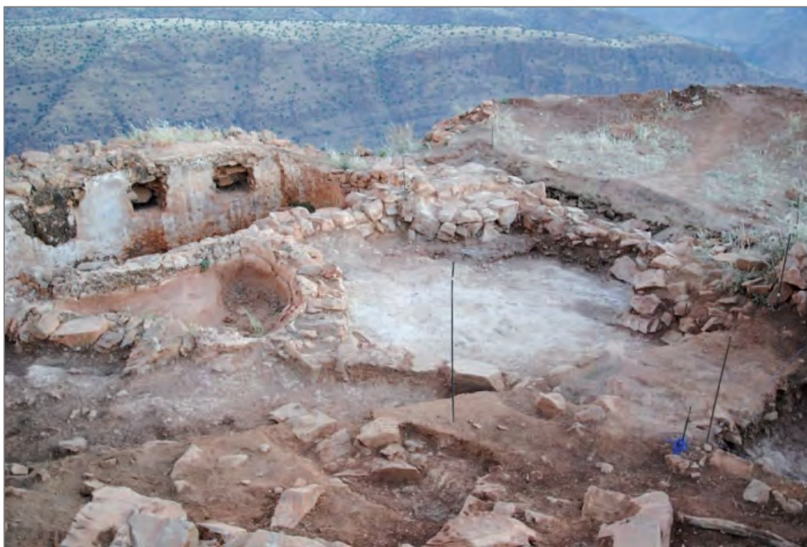
Fig. 3. Extension de la basse-cour de la Qasba, citerne 5.

de la petite mosquée. Il se confirme encore une fois combien la Qasba semble composée de pièces hiérarchisées entre elles, et aux fonctions bien précises. Les deux pièces 33 et 34 sont également situées non loin de ce que nous avons pris l'habitude de désigner par « entrée sud-est de la Qasba », tant il nous paraissait évident que le passage ménagé en ce lieu ne pouvait correspondre qu'à un accès mettant en relation l'extérieur de la Qasba — marqué par l'implantation en ce lieu d'une citerne de grande capacité : la citerne 5 — avec la basse-cour. Force nous a été cette année d'invalider notre hypothèse, lorsqu'il est apparu clairement que la citerne 5, bien que située en dehors de l'emprise de l'enceinte de la Qasba, n'en constituait pas moins une réelle extension, ou plus exactement que cette citerne avait été, pour d'évidentes raisons stratégiques, annexée à la Qasba au moyen dudit passage. La fouille de l'esplanade au-devant de celui-ci a en outre permis de dégager le système d'alimentation de la citerne depuis la basse-cour : dans sa zone d'extension, la citerne 5 est précédée de son bassin de décantation. Au centre se trouve l'esplanade revêtue de tafza et, en avant de celle-ci, le muret de dérivation des eaux servant à alimenter le bassin de décantation, puis la citerne, avec les eaux de ruissellement provenant de la basse-cour de la Qasba, située dans le prolongement de la photo à droite (fig. 3).