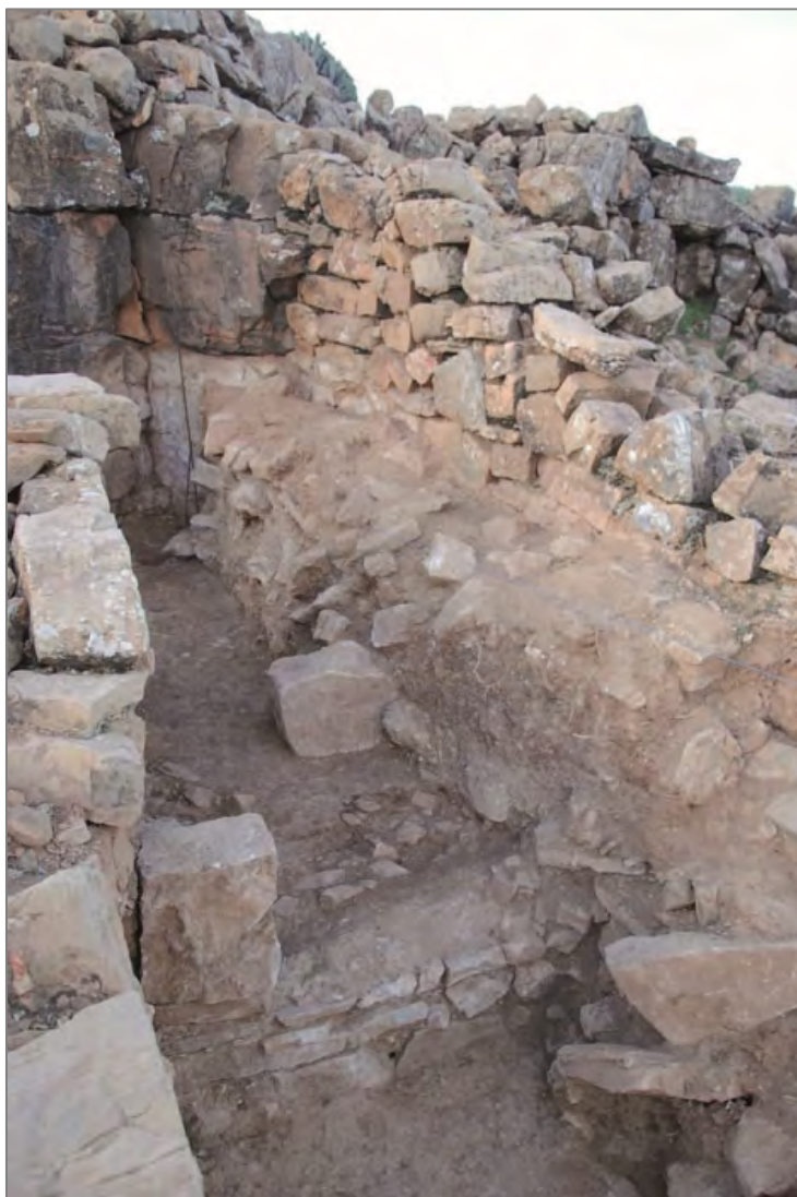
Fig. 2 : La poterne du front occidental de l'acropole d'Îgîlîz en fin de fouilles.

Il avait enfin été convenu de profiter de cette mission exempte de fouille extensive pour mener à bien, au niveau de la Qasba, une opération de nettoyage de grande envergure, longtemps reportée faute de temps et de moyens humains à lui consacrer : l'épierrage périphérique du mur d'enceinte de la basse-cour, et l'enlèvement d'un imposant tas de déblais (surnommé quelque peu pompeusement par l'équipe « la ziggourat ») au cœur de la zone sommitale. Ces opérations, rendues pénibles par le volume imposant de pierres à déplacer, ont impliqué le recrutement sur place d'une trentaine d'ouvriers. Le résultat final est particulièrement spectaculaire : ainsi, pour la première fois depuis le début des opérations de fouille sur la montagne d'Îgîlîz, la cour de la zone de commandement de la Qasba apparaît-elle dans toute son ampleur (fig. 2).