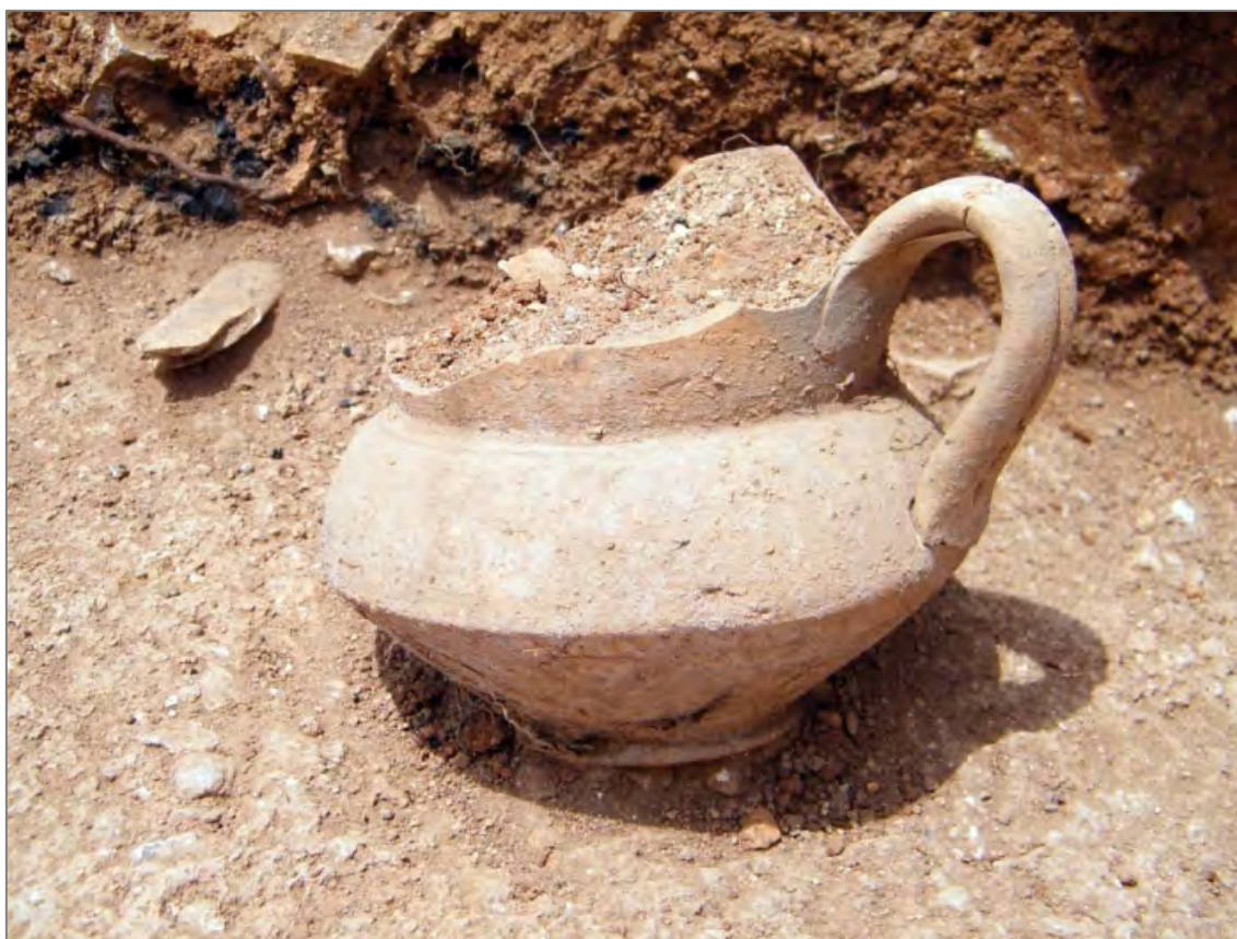
Fig. 3. Petite jarre trouvée dans les rejets de la cuisine.

À cet endroit, de nombreux foyers ont en effet été repérés et fouillés. Ils sont accompagnés de rejets particulièrement riches en mobilier osseux, céramique et métallique. Soulignons la découverte, dans ces dépotoirs, de restes de poissons, d'une lame de couteau en fer avec rivets de fixation et d'une jarre à filtre presque complète (fig. 3). Ces remblais constituent la dernière occupation de ces espaces, dont la fouille, là encore, a été stoppée avant d'atteindre les niveaux les plus anciens.