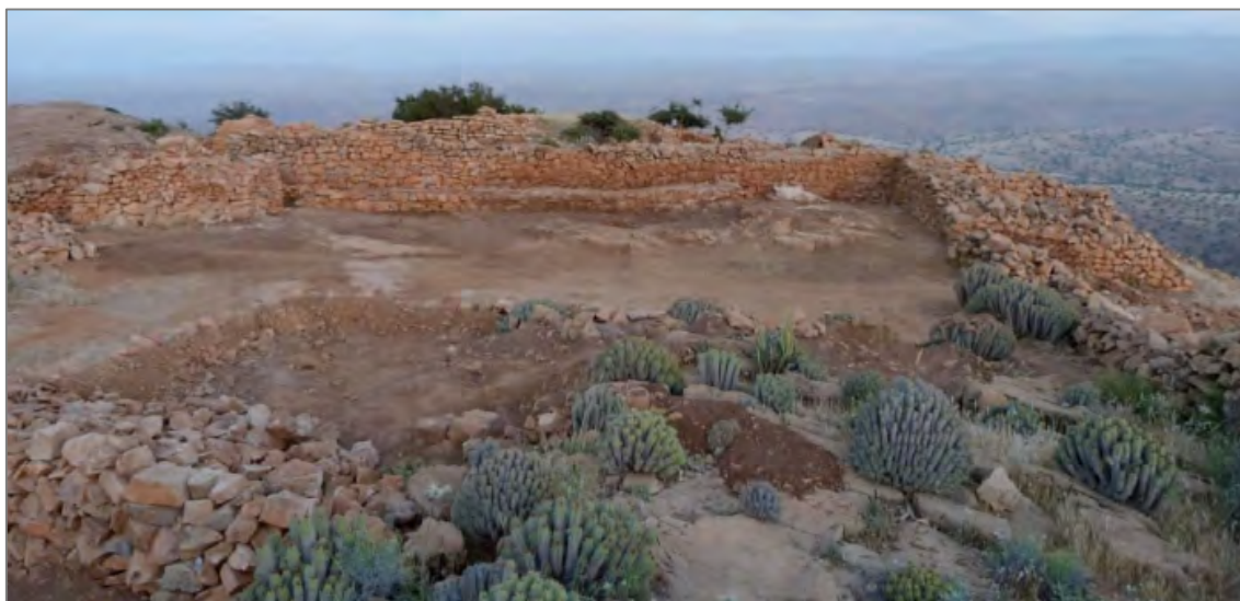
Fig. 5. La façade occidentale de la zone de commandement de la Qasba, vue de l'ouest. La façade, contre laquelle s'appuie une longue banquette destinée à accueillir les visiteurs avant qu'ils ne soient autorisés à entrer dans la Qasba, est encadrée par deux tours : à gauche, le massif d'entrée ; à droite, la tour sud-ouest, dont l'accès a été dégagé cette année.

d'autres points du site. Le recentrage des opérations de fouille dans le secteur a permis de mobiliser les forces nécessaires pour procéder à l'évacuation d'une épaisse couche d'éboulis (parfois haute de 1 mètre) qui masquait encore l'essentiel des structures. Ce dégagement a fourni l'occasion de nouvelles observations sur le côté de la Qasba qui en constituait l'entrée officielle : un long banc de pierre, destiné à l'attente des visiteurs, court tout au long du mur de façade, non loin de la porte principale. Le nettoyage des structures s'insère désormais dans un projet de définition des circulations sur le site, de manière à assurer une bonne gestion des visites de personnes étrangères à la mission.