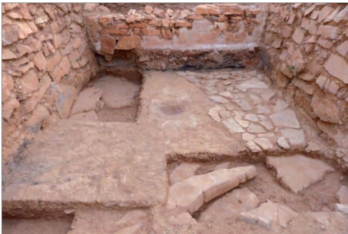
Fig. 2. Qasba, pièce 3, états 1 et 2 (« préQasba »). Au centre, le foyer initial récupéré dans le 2 e état, marqué par la mise en place d'une couche préparatoire en dalles (à droite) ; au-dessus, le niveau d'incendie qui sera suivi par l'implantation de la Qasba autour de la pièce 3. Au premier plan, le substrat rocheux sur lequel la pièce est installée.

communautaire (ou maison de chef ?), puis pièce principale de toute la Qasba. Du début à la fin de son utilisation, cette pièce semble avoir eu comme vocation principale la réception. C'est là un élément de continuité capital dans la compréhension des modalités d'apparition brusque de la Qasba — et donc d'un pouvoir fort et soucieux de paraître — au sommet de la montagne. Les trois pièces fouillées ont confirmé par ailleurs les datations déjà obtenues dans ce secteur : la Qasba est construite dans la première moitié du XII e siècle, et est abandonnée au plus tard au milieu du même siècle.