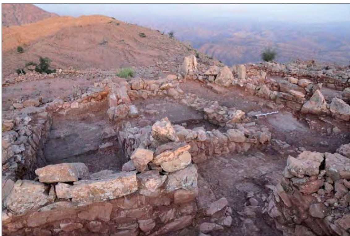
Fig. 3. Vue générale de l'ensemble domestique dégagé en 2012 dans la zone 2.