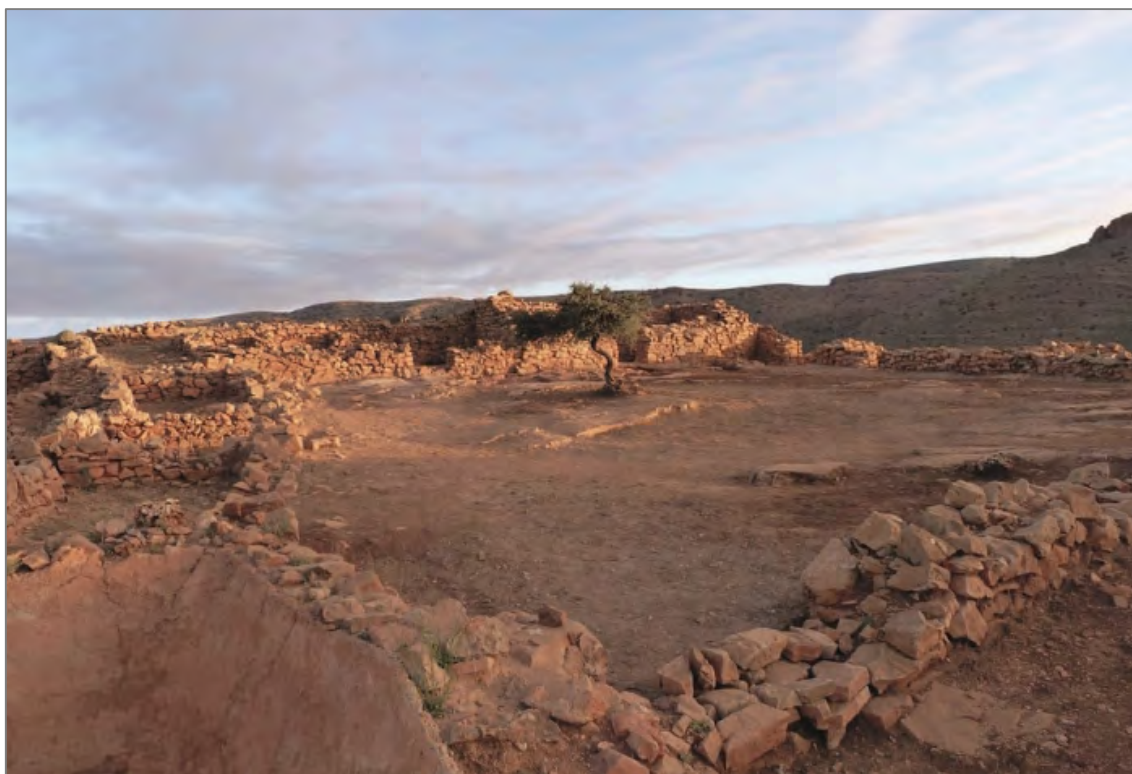
Fig. 1 : Vue d'ensemble de la cour de la zone de commandement, Qasba d'Îgîlîz.

Après six campagnes de fouilles sur la montagne d'Îgîlîz, la direction de la mission avait souhaité marquer une pause cette année dans les opérations de dégagement des structures archéologiques. Il semblait souhaitable en effet de consacrer le traditionnel séjour printanier de l'équipe sur le terrain à l'acquisition de données complémentaires susceptibles d'alimenter la rédaction en cours de la première monographie consacrée au site, sans ouvrir de nouveaux secteurs à la fouille extensive. Des sondages ou dégagements de surface d'ampleur réduite ont été pratiqués dans des zones déjà fouillées, ou en limite de celles-ci, toujours à des fins de vérification : on notera tout particulièrement, dans la partie nord de la basse-cour de la Qasba, le décapage qui a révélé un niveau d'occupation d'époque almohade composé de divers foyers et du sol de circulation associé, et le déblaiement suivi de fouille qui a mis au jour, à l'extrémité occidentale de l'acropole d'Îgîlîz, une poterne en excellent état de conservation (fig. 1).