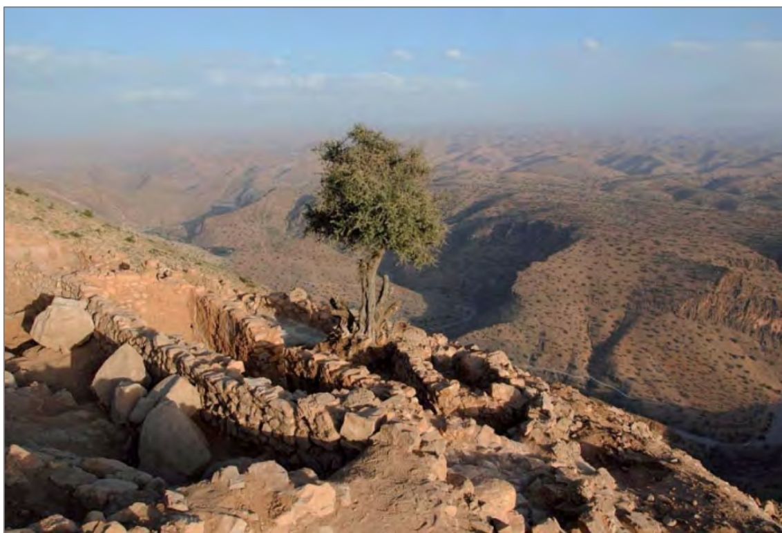
Fig. 5. Vue d'ensemble de la maison sud, dans le quartier du « Grand Bâtiment » ; la maison est implantée contre la muraille haute du Jebel central.

l'ensemble des structures situées sur son pourtour. C'est ainsi un véritable quartier d'habitations qui sort peu à peu de son épais manteau d'éboulis, révélant des maisons organisées autour de deux axes de circulation perpendiculaires et d'une cour située au sud du « Grand Bâtiment », l'ensemble résultant sans nul doute d'une opération de planification. Les pièces, dont l'élévation conservée est parfois remarquable, ont livré un matériel céramique d'époque almohade particulièrement abondant, et des aménagements soignés (banquettes, foyers). La fouille de cette année (resp. F. Renel et C. Touihri) s'est intéressée au secteur le plus méridional de ce quartier, mettant en lumière l'existence d'ensembles domestiques plus articulés, comprenant leurs propres espaces de réception. À l'hypothèse initiale de la juxtaposition de petites maisons dans la dépendance d'un imposant bâtiment de représentation, se substitue aujourd'hui l'idée d'un quartier comportant, outre un bâtiment très certainement utilisé comme lieu de réception et de représentation, d'autres maisons complexes, aux espaces et aux cheminements bien hiérarchisés, et dotées parfois d'équipements urbains (latrines).