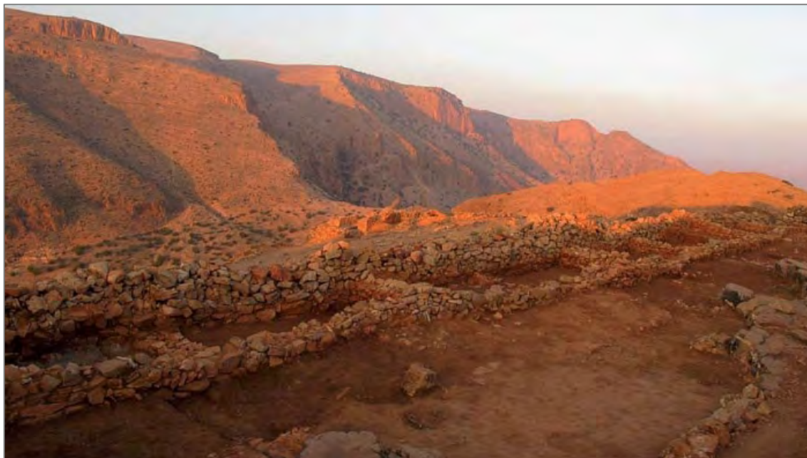
Fig 1. Vue générale de l'aile nord de la basse-cour de la Qasba ; les pièces rectangulaires sont adossées au mur d'enceinte de la Qasba.

définitif. Le riche mobilier retrouvé sur les sols des pièces ou dans la cour renforce encore cette impression d'une désertion radicale, alors même que les autres secteurs d'habitat continuaient à être occupés. La chronologie relative fournie par le matériel céramique nous ramène encore une fois très vraisemblablement à la première moitié du XII e siècle.