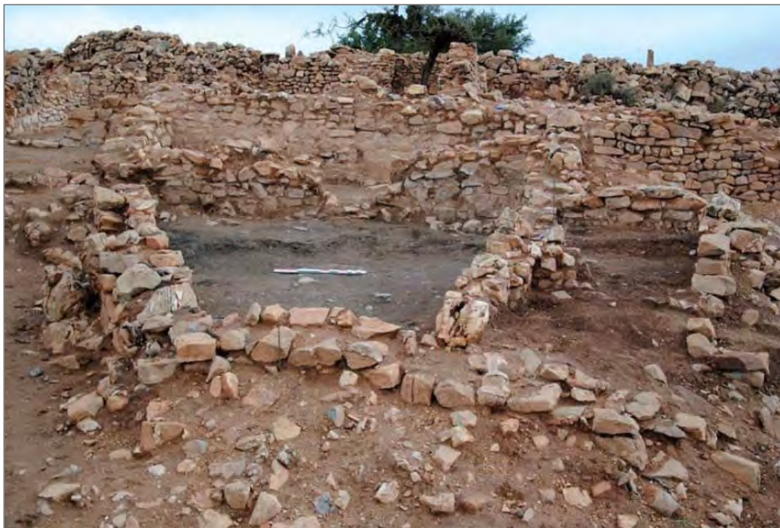
Fig. 2. Vue générale de la pièce 90, avec ses abondants épandages de cendres et ses foyers.

de repas communautaires sur le Jebel central dès la période almohade. On notera en outre que le secteur fouillé cette année a livré, outre une impressionnante quantité de céramiques, les premières traces d'objets en verre répertoriés sur le site d'Igîlîz.