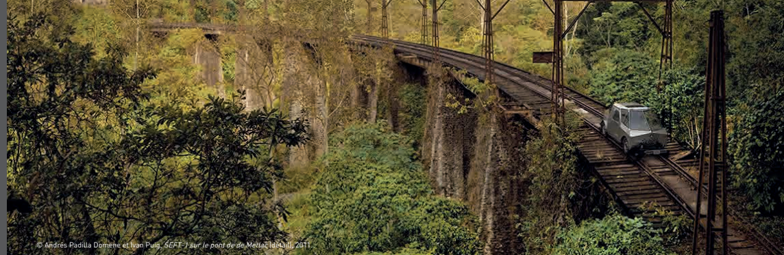
© Andrés Padilla Domene et Ivan Puig, SEFT-1 sur le pont de Meliá (2011).