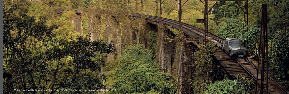
© Andrés Padilla Domène et Ivan Puig, SEFT-1 sur le pont de de Métales (Baillet), 2011.