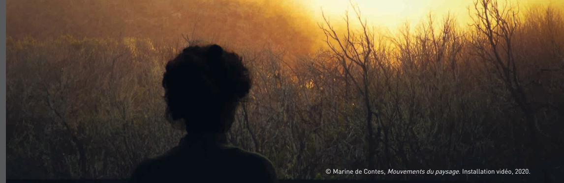
© Marine de Contes, Mouvements du paysage . Installation vidéo, 2020.