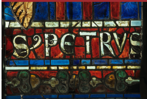
Bourges, cathédrale. Vitrail de saint Pierre (xiii e siècle)