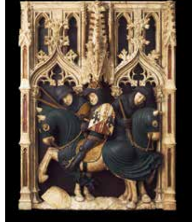
▲ Ceremonia funeraria, Sepulcro de Fernando de Antequera , Pere Oller, primera mitad del siglo XV, Museo del Louvre.