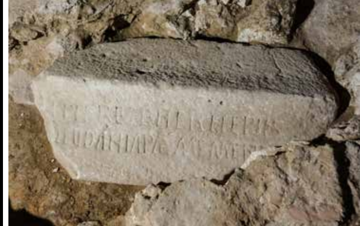
▲ Losa donde se recuerda a Teudano, abad de Irache en el siglo X, hallada en las excavaciones de su iglesia en diciembre de 2018

El comportamiento ante la muerte de las élites dirigentes de la sociedad medieval nos permite conocer las aspiraciones colectivas de tipo político, cultural y espiritual de este período. La muerte del príncipe -es decir, de las oligarquías- en la Edad Media, se aborda aquí a partir de conceptos como la memoria, la liturgia, la legitimidad, la representación y propaganda o los espacios privilegiados para la sepultura. Y todos ellos dibujan un escenario de continuidad y progreso en la construcción del poder, mucho más que de ruptura con el pasado.