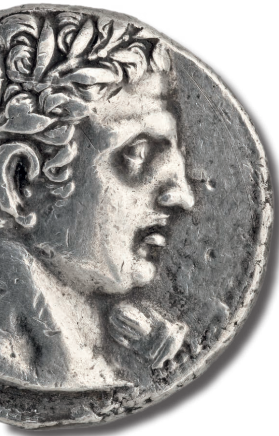
Trishekel hispano-cartaginés de plata, hacia 237-227 a.C. (MAN, 1993/67/1551)