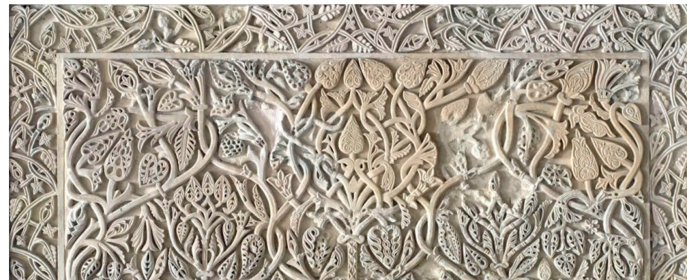
Decoración parietal del Salón Rico, Madinat al-Zahra'