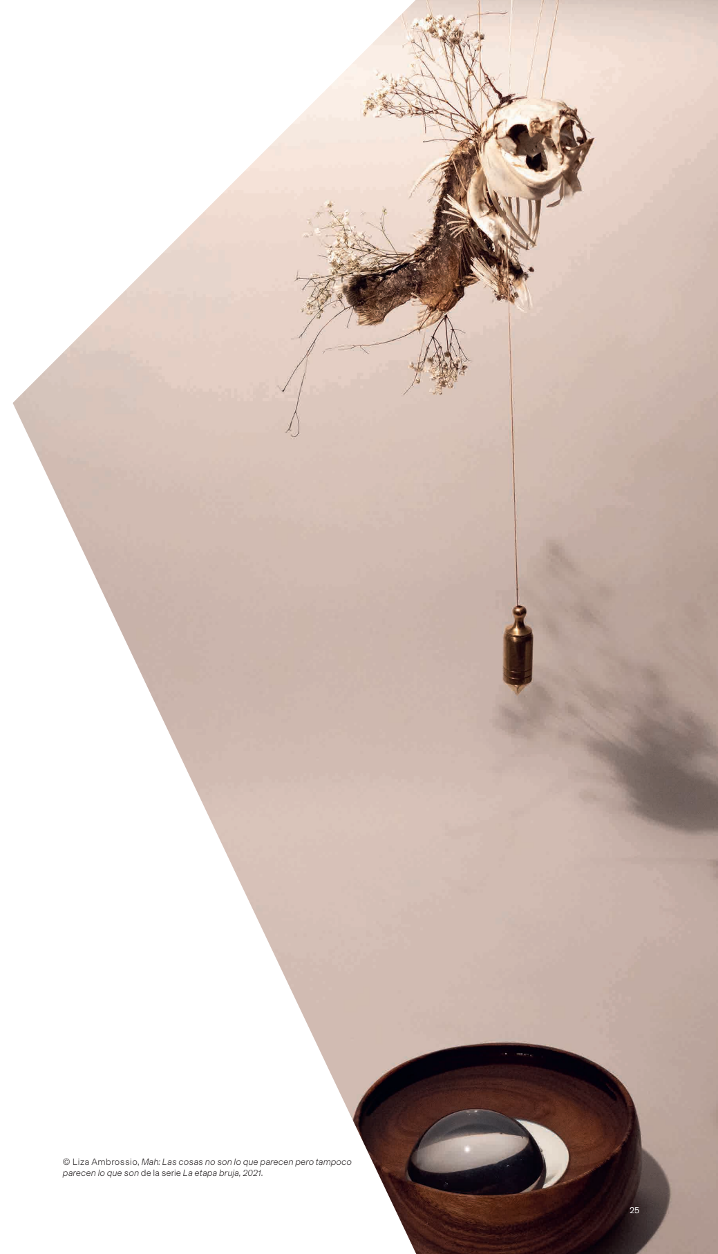
© Liza Ambrossio, Mah: Las cosas no son lo que parecen pero tampoco parecen lo que son de la serie La etapa bruja , 2021.

¿Márgenes conectadas? Espacios transfronterizos y circulaciones ibéricas (confines septentrionales y amazónicos del mundo ibero-americano, siglo XVIII – siglo XXI)