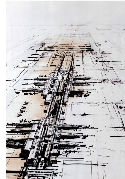
© Charles VILLENEUVE, Vue générale , 2000 Dibujo sobre papel, 92 x 126 cm

EXPOSICIÓN DE ARTISTAS DE LA CASA DE VELÁZQUEZ ACADÉMIE DE FRANCE À MADRID